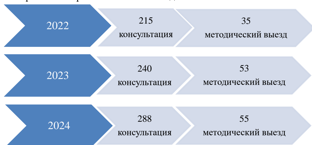
Рис. 2. Динамика количества методических консультаций и выездов за 2022–2024 гг.

Формами методической работы являлись выезды на места и консультации специалистам по разным вопросам библиотечной деятельности.